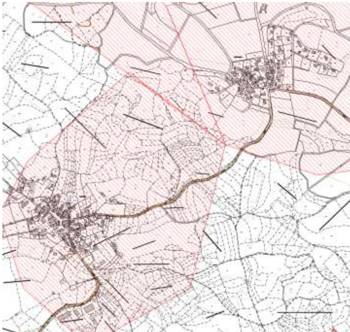
Karte 5: Trainmeusel, Birkenreuth