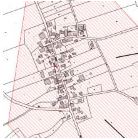
Karte 3: Albertshof