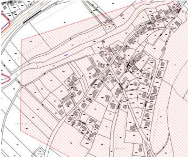
Karte 6: Niederfellendorf